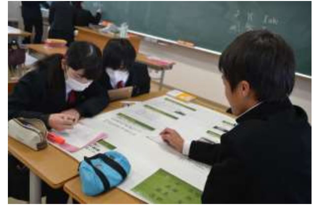
↑成果発表に向けての練習の様子。一人ひとりが発表できるよう練習をしました。チームでコミュニケーションをとりながら目的に向かって取り組むことの大切さも奥出雲学を通して学びました。