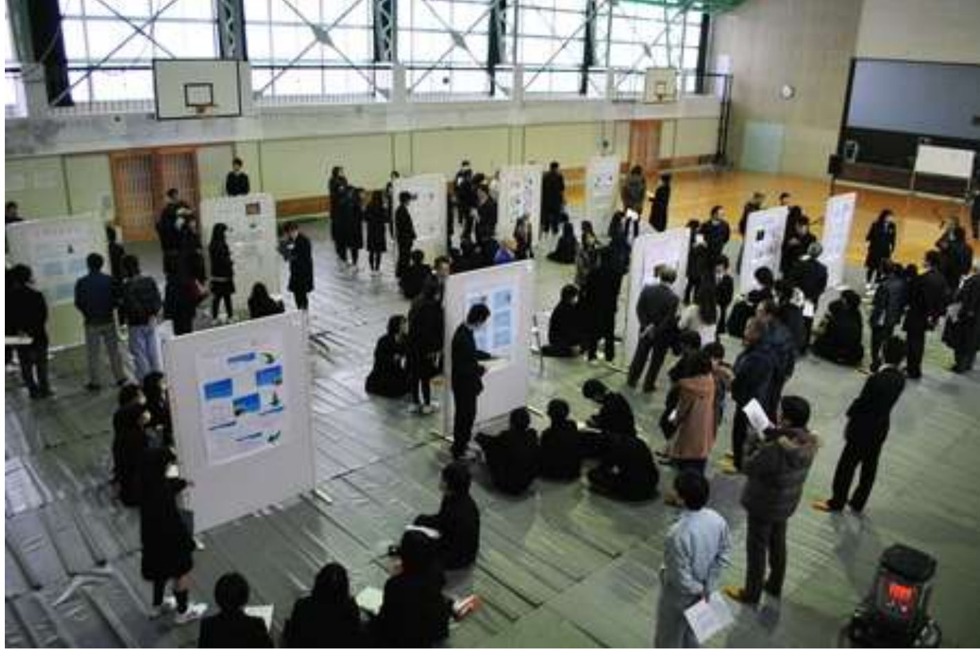
奥出雲町内の事業所さま、町外からも行政・教育関係者や大学生など、40名をこえる方々にお越し頂きました。本当にありがとうございました。

1月27日(水)、1年生の「総合的な学習の時間」における「奥出雲学」の成果発表会を実施しました。「奥出雲学」は、奥出雲で生きる人々の職業観や地域資源、生き方を学び、今後の進路選択や高校生活に活かすことを目的とした取り組みです。発表はポスターセッション形式で行いました。パネルに貼られた各チームの発表資料の前で、発表・質疑応答しました。